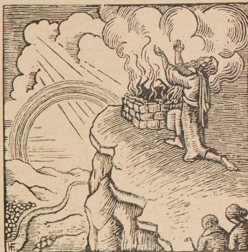
„Es sei der Bogen in der Wolke, ich sehe ihn an und gedenke meines Bundes“ (1. Buch Moses 9,12)

Wir Juden hatten bis zu unserer Zeit wenige Künstler, die willentlich oder ihrer Eigenart nach Schilder unserer Volksseele gewesen wären. Daß sowohl unsere religiöse Einstellung, wie auch das Galuth wesentlich dazu beitrug, braucht nicht erst erwähnt zu werden. Unsere Feinde machten uns diesen Mangel mit mehr oder weniger Berechtigung zum Vorwurf. Und doch hat eine neue jüdi-